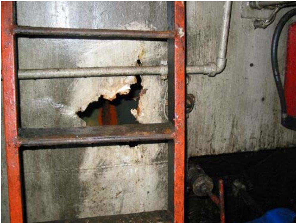
Abbildung 7, Motorenraum Stb. achtern