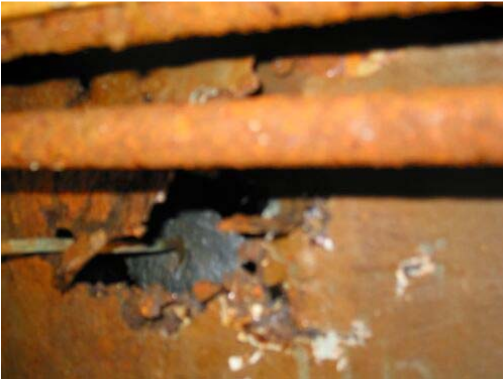
Abbildung 4, Achterpiek Bb. vorne