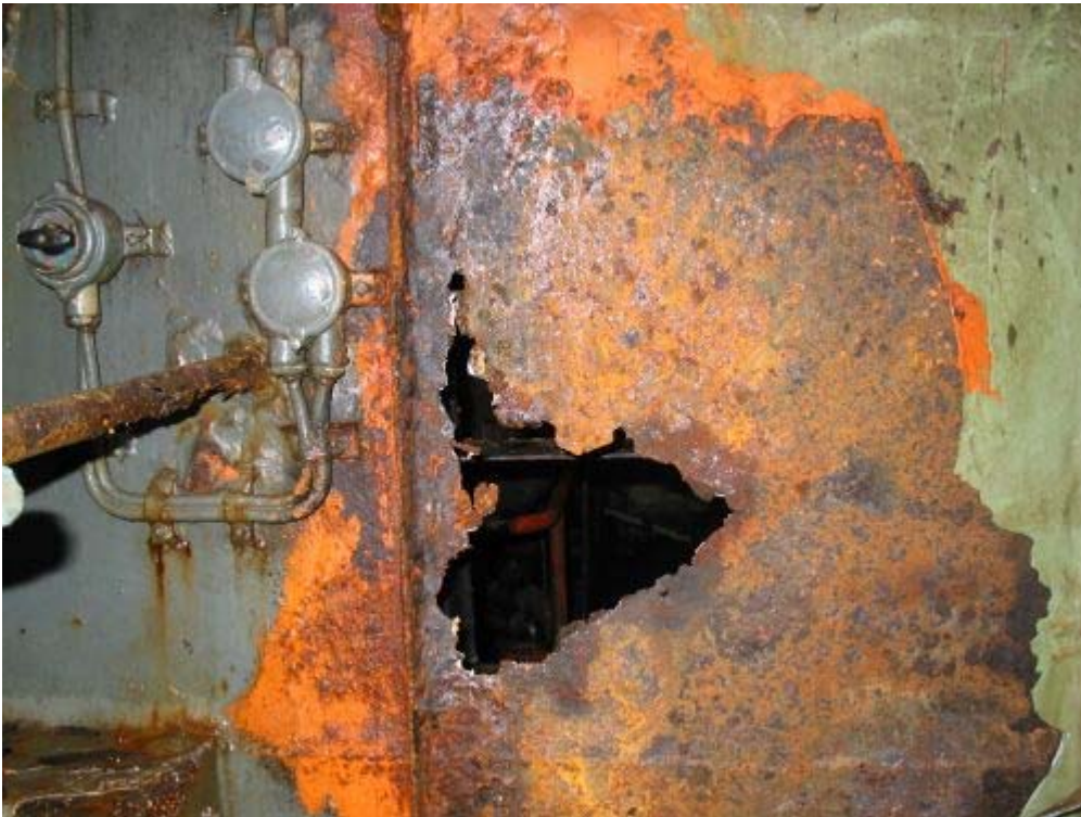
Abbildung 6, Stauraum Stb. vorne