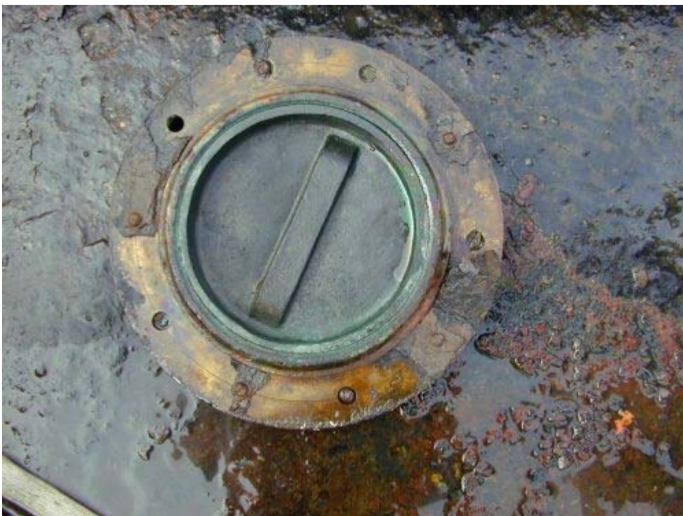
Abbildung 3, Hauptdeck Bb.-Seite