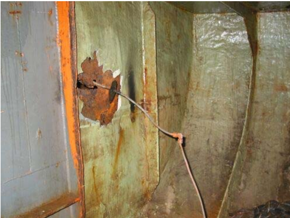
Abbildung 5, Stauraum Bb. achtern