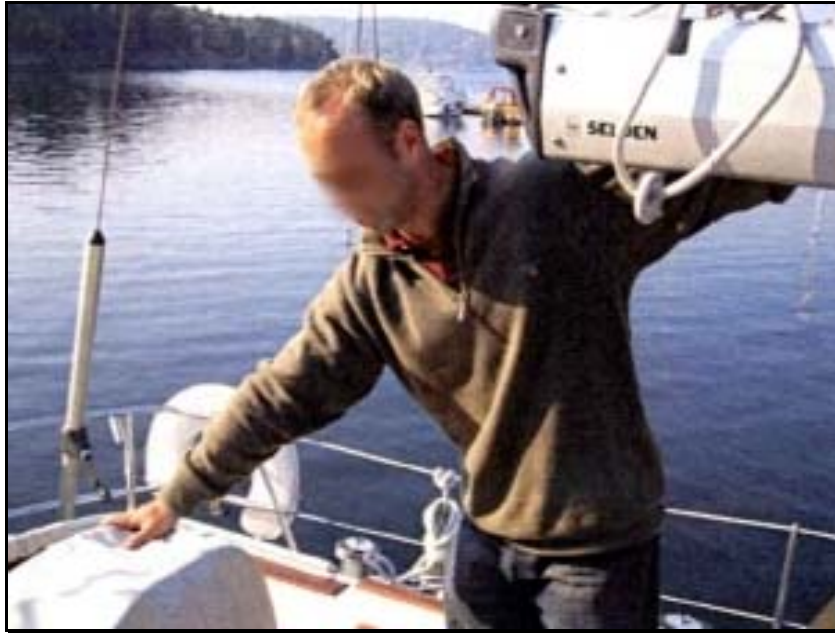
Abbildung 4: Nachstellen der Unfallposition

Punkt B (die Sitzbank) befindet sich ca. 0,40 m über dem Cockpitdeck. Der Baum würde eine dort stehende Person am Kopf treffen, wenn sie aufrecht stehen würde. Wenn die Person gleichzeitig nach hinten an das Ruder greifen wollte, müsste sie sich stark nach achtern lehnen und würde dann nicht vom Baum getroffen werden können.