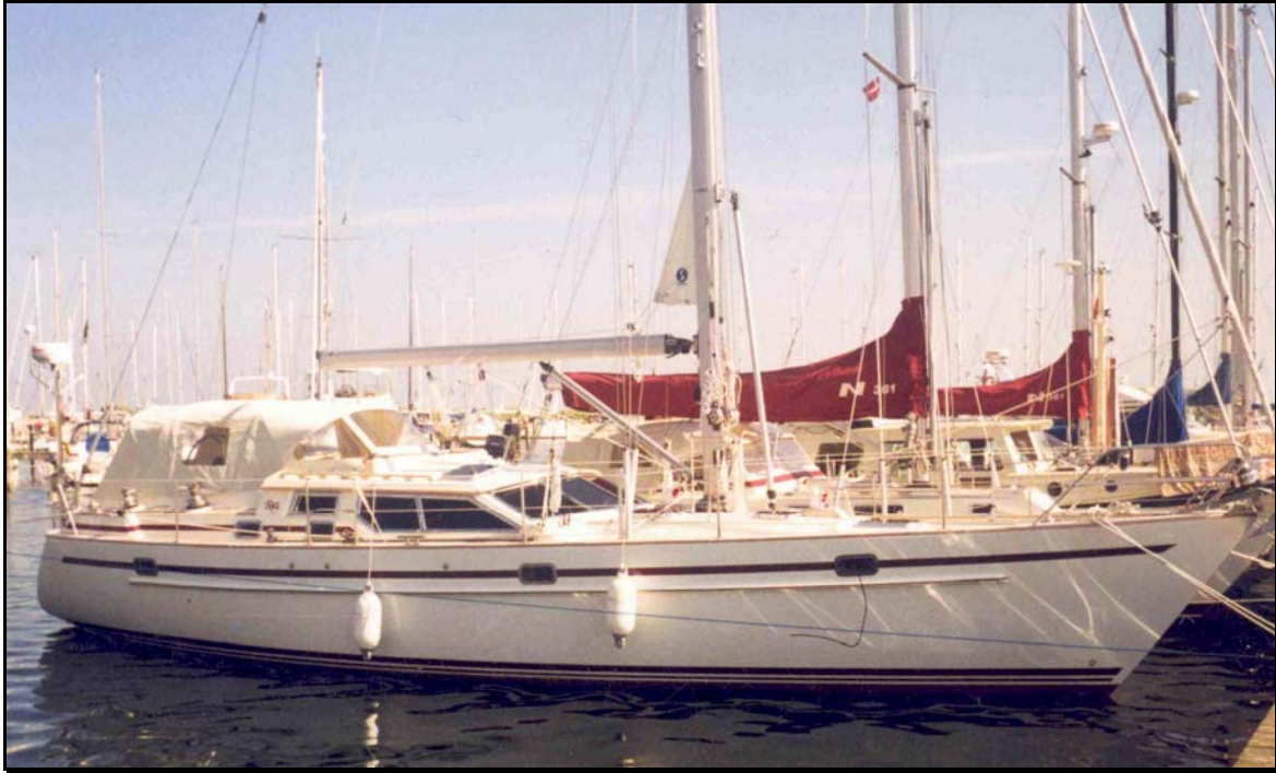
Abbildung 2: SY ANDREA