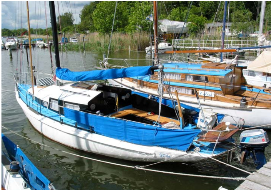
Abbildung 2: SY SAMOA im Heimathafen Dreilindengrund