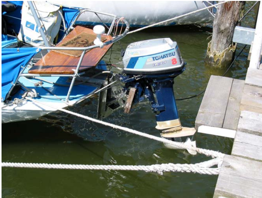
Abbildung 5: Außenbordmotor in Standby-Position

Das Untersuchungsteam der BSU hat in diesem Zusammenhang im Übrigen festgestellt, dass zum Bedienen der Absenkvorrichtung des Motors ein nicht ungefährliches Hinausbeugen über die Achterkante des Bootes erforderlich ist (vgl. Abbildung 5 ).