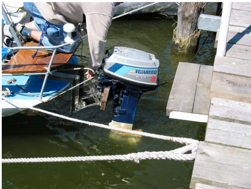
Abbildung 6: Arbeitsgang zum Absenken des Außenbordmotors