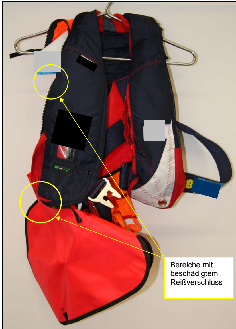
Abbildung 5: Halb entfaltete Rettungsweste

An der Reling am Heck waren zwei automatisch aufblasbare Markierungsbojen, die in dazugehörigen kleinen Behältnissen gelagert waren, befestigt. Es befand sich weiterhin eine feste Bergeschlaufe an einer langen schwimmfähigen Leine und eine Wurf-Rettungsleine in einem dazugehörigen Wurfbeutel an Bord.