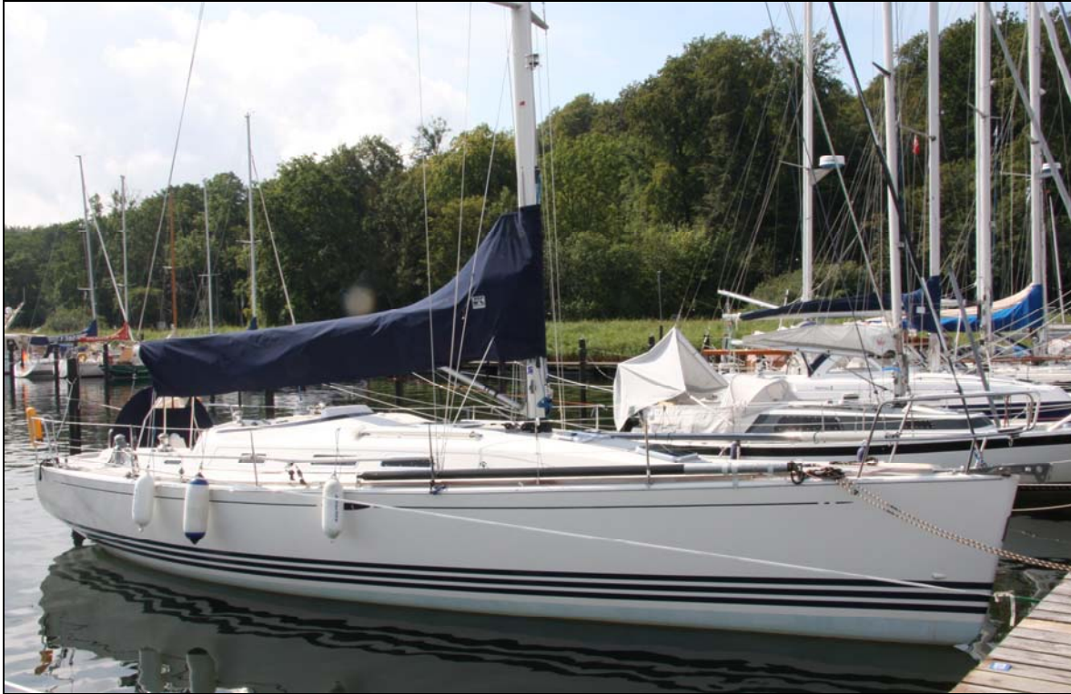
Abbildung 1: Segelyacht CROSS-MATCH