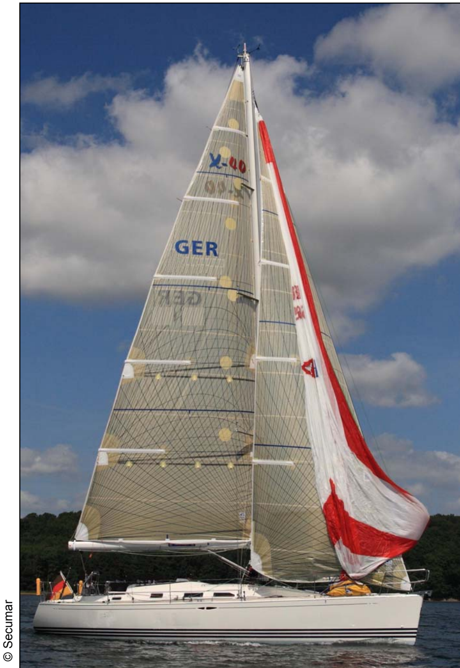
Abbildung 4: CROSS-MATCH mit Regattabesegelung