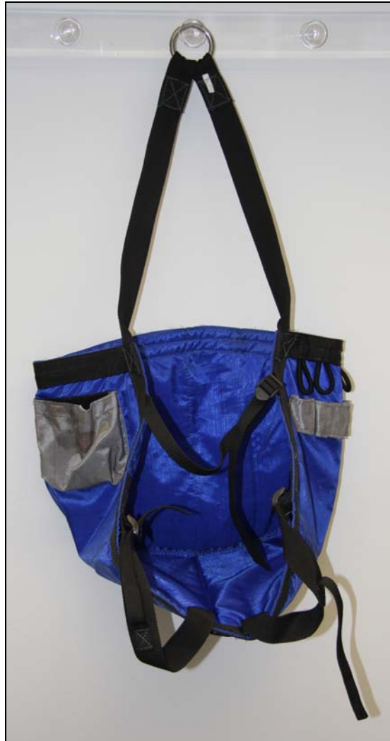
Abbildung 6: Bootsmannsstuhl der CROSS-MATCH

An der Vorderseite war ein zusätzlicher Brustgurt befestigt. Dieser war zum Zeitpunkt der Inaugenscheinnahme an der linken Nahtstelle abgerissen. An den Seitenteilen und am Rückenteil waren Staumöglichkeiten für Werkzeug und Ersatzteile angebracht.