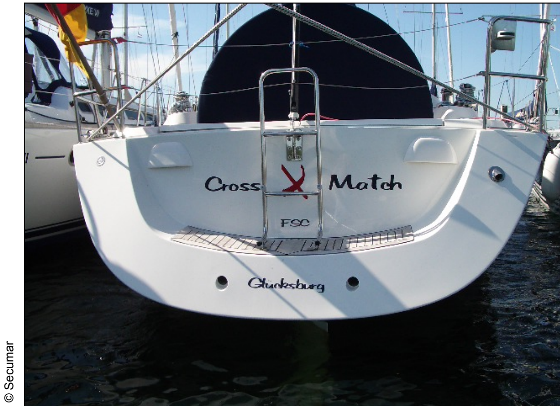
Abbildung 3: Heck der CROSS-MATCH

Vor Ort, bei glattem Wasser, mit Standardausrüstung und ohne Crew wurden die folgenden Abmessungen festgestellt: Die Größe der Teakfläche und damit der Standfläche auf der Badeplattform betrug 128 cm x 31 cm. Die effektive Länge der Badeleiter betrug ca. 90 cm. Im herabgelassenen Zustand tauchte die Badeleiter ca. 37 cm ein. Bei einem Stufenabstand von 34 cm war die zweite Stufe gerade vom Wasser bedeckt. Die Unterkante des Hecks befand sich dabei ca. 15 cm über der Wasseroberfläche. Die Höhe des Heckspiegels betrug ca. 36 cm.