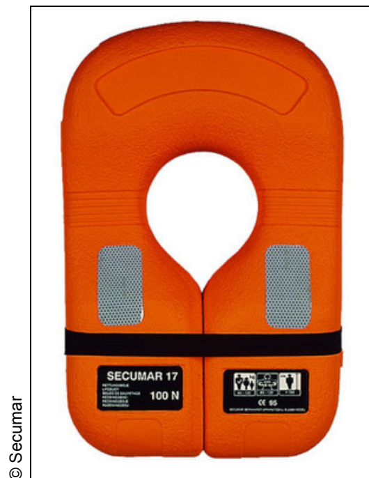
Abbildung 8: Feststoffweste Secu 17

Zum anderen ist es die Eignung der abgebildeten Feststoffweste (Abbildung 8), die von mehreren Herstellern angeboten wird, als schnelles Hilfsmittel für Überbordgefallene ohne Rettungsweste. Die Feststoffweste kann gut geworfen werden. Eine daran befestigte Leine erweitert die Einsatzmöglichkeit. Entscheidend ist aber, dass Personen die bei Bewusstsein sind den Schwimmkörper einfach öffnen und über den Kopf streifen können. Aufgrund einer Vorspannung hält die Feststoffweste auch ohne weitere Befestigung am Hals und hält so den Kopf eines Schwimmers über Wasser. Diese Eigenschaft ermöglicht aber auch ein einfaches Überstreifen durch einen Helfer bei geschwächten oder bewusstlosen Personen.