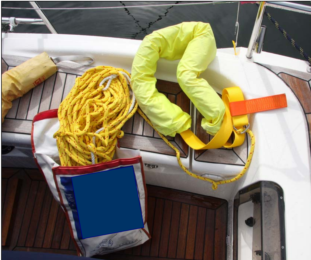
Abbildung 7: CROSS-MATCH, Bergeschlaufe mit schwimmfähiger Leine

Während des Versuchs der Bergung der Bootsführerin wurde der ersten Retterin eine Bergeschlaufe (Abbildung 7) zugeworfen. Diese diente anscheinend im weiteren Verlauf nur zum Heranholen der beiden Personen an die Yacht. Die Bergeschlaufe hätte zwar einerseits ein gutes Hilfsmittel zum Halten der Bootsführerin an der Yacht und für eine Bergung darstellen können, andererseits hätte die Bergeschlaufe dafür am leblos erscheinenden Körper der Bootsführerin fixiert, d.h. unter den Armen hindurchgeführt werden müssen. Das war aber offensichtlich aufgrund des Abstandes zur Wasseroberfläche weder für die Personen auf der Badeplattform noch, aufgrund der eigenen aufgeblasenen Rettungsweste, durch die Personen im Wasser möglich. Die Bauart der Bergeschlaufe, die Schlaufe konnte an keiner Seite geöffnet werden, war dabei zusätzlich hinderlich.