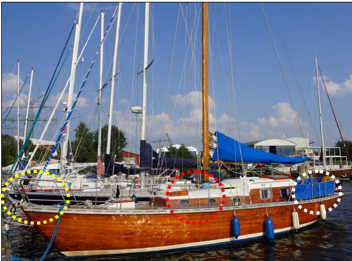
Abbildung 4: Aufenthaltsorte der Besatzungsmitglieder zum Unfallzeitpunkt

In der nachfolgenden Abbildung 4 , die die DESDEMONA zu einem späteren Zeitpunkt an ihrem Liegeplatz in Lübeck-Travemünde zeigt, sind die vorstehend beschriebenen Positionen, an denen sich die vier Besatzungsmitglieder unmittelbar vor bzw. zum Unfallzeitpunkt befanden, farblich markiert. Innerhalb des rot markierten Kreises befand sich das spätere Unfallopfer.