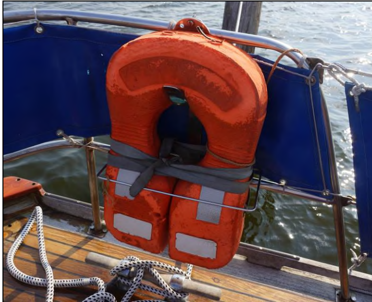
Abbildung 5: Rettungskragen im achteren Bereich der Yacht