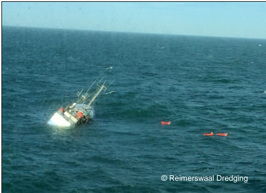
Abbildung 4: Die Besatzung der KRISTINA hat den Kutter verlassen