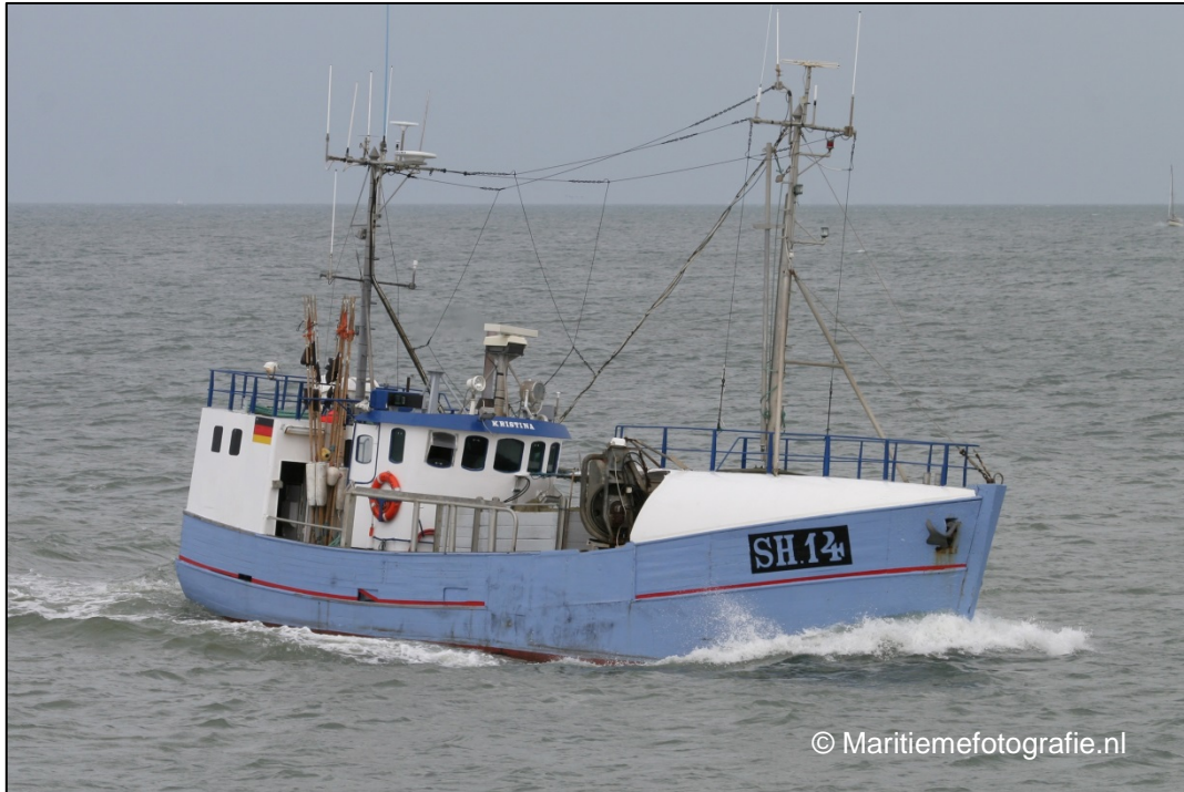
Abbildung 1: Schiffsfoto KRISTINA