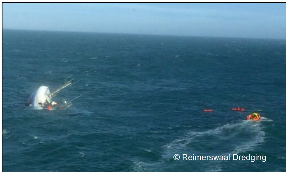
Abbildung 5: Situation kurz vor der Rettung

Während des Untergangs des Kutters lösten automatisch die EPIRB 8 und das Rettungsfloß aus. Der Alarm der EPIRB wurde um 10:55 Uhr durch das Kontrollzentrum aufgenommen, an das RCC 9 Münster weitergeleitet und von dort an die DGzRS übermittelt. Das Rettungsfloß wurde durch die GLOMAR COMMANDER aufgenommen.