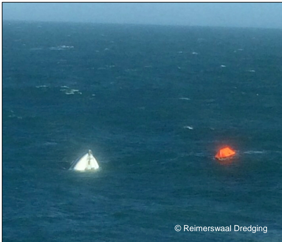
Abbildung 6: KRISTINA und selbsttätig ausgelöstes Rettungsfloß

Da die unverletzte Besatzung der KRISTINA an Bord der REIMERSWAAL keine weitere Hilfe benötigte, wurde der Rettungseinsatz beendet. In Abstimmung mit den Beteiligten setzte der Bagger die Reise zu seinem Bestimmungshafen Harlingen fort und erreichte diesen gegen 21:30 Uhr. Von hier aus reiste die Besatzung der KRISTINA nach Hause.