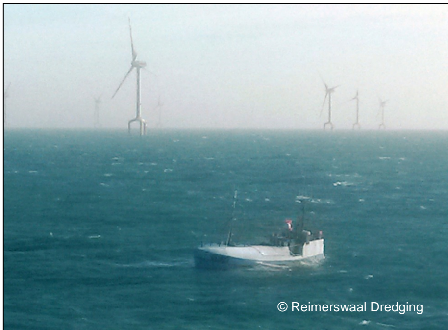
Abbildung 3: Die KRISTINA bei der Ankunft der REIMERSWAAL

Die REIMERSWAAL erreichte als erstes Fahrzeug um 10:23 Uhr die KRISTINA. Zu diesem Zeitpunkt schwamm der Fischkutter noch in normaler Lage, tauchte aber bereits bis zum Hauptdeck ein (siehe Abbildung 3). Die Besatzung der REIMERSWAAL begann mit der Vorbereitung für den Einsatz ihres Bereitschaftsbootes und hatte Funkkontakt zur Besatzung der KRISTINA. Um 10:45 Uhr teilte die Besatzung der KRISTINA mit, dass sie die Brücke verlassen und sich auf das Hauptdeck begeben würde. Als die KRISTINA um 10:47 Uhr begann, Schlagseite nach Steuerbord zu bekommen, sprang die Besatzung des Kutters in ihren Eintauchanzügen über Bord. Sie führte dabei auch ein tragbares UKW-Funkgerät mit sich. Die Besatzung der REIMERSWAAL setzte sofort ihr Bereitschaftsboot aus. Es wurde mit zwei Mann besetzt und fuhr in Richtung der KRISTINA. Deren Besatzung war wenig später aufgenommen. Schon während der Aufnahme der Besatzung der KRISTINA begann der Fischkutter, über das Heck wegzusacken. Als das Bereitschaftsboot zurückkehrte, war nur noch der Bug des Kutters zu sehen. Um 11:00 Uhr waren alle Personen wohlbehalten an Bord der REIMERSWAAL. Zu diesem Zeitpunkt versank die KRISTINA. Wenig später erreichte auch die GLOMAR COMMANDER den Unfallort.