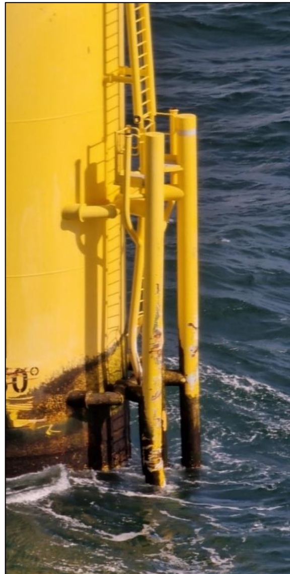
Abbildung 6: Angefahrene WEA im Zoom 5

Schwerpunkte dieser besonderen Untersuchung sind neben der Mindestbesetzung von Seeschiffen auch die Überwachung des Schiffsverkehrs durch die Vkz Wilhelmshaven sowie der Überwachungszentrale des Windparkbetreibers.