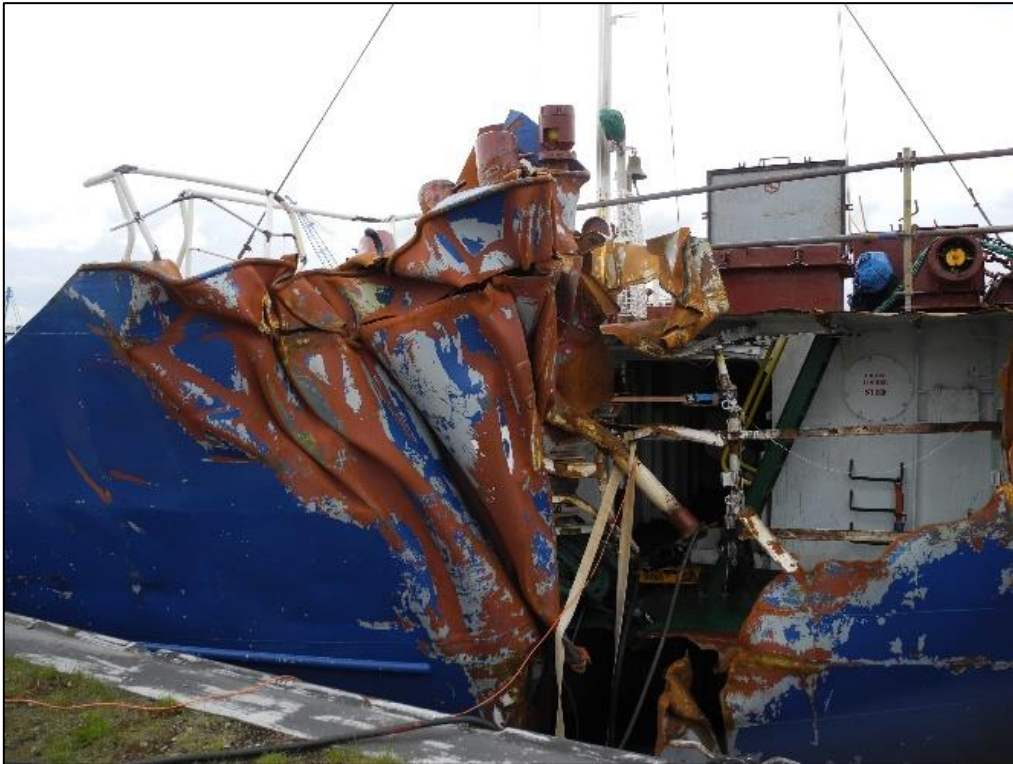
Abbildung 3: Die aufgerissene Steuerbord-Seite der PETRA L 3