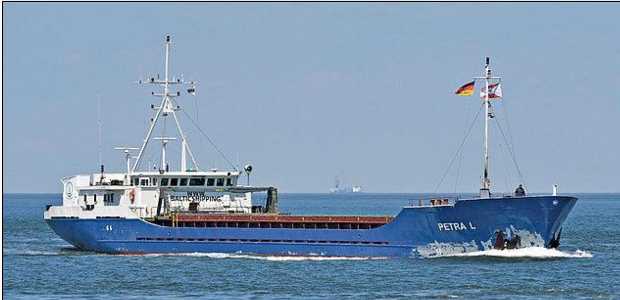
Abbildung 1: Die unbeschädigte PETRA L 1