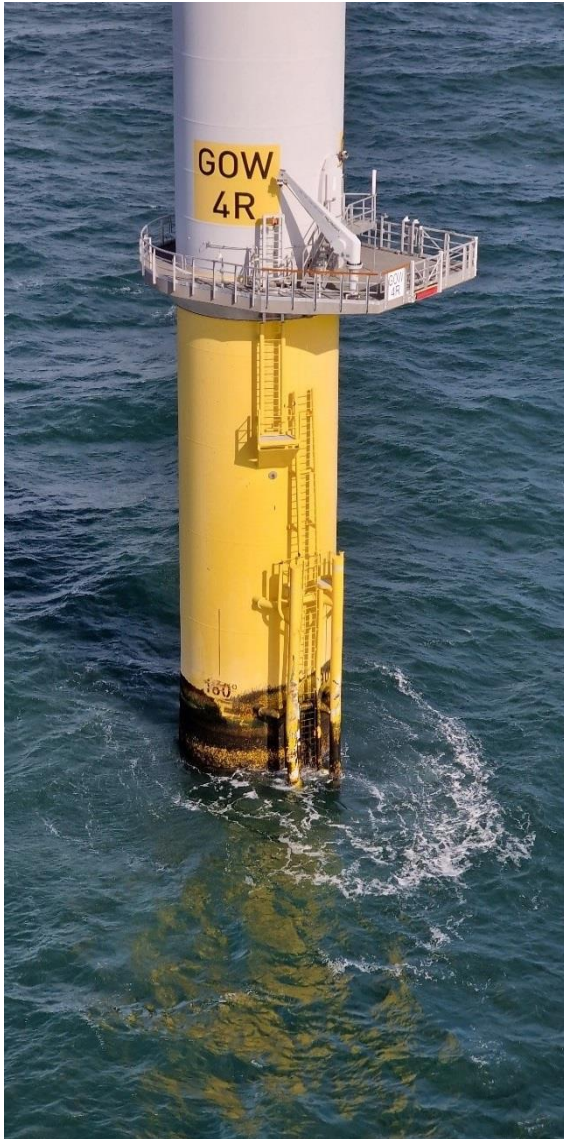
Abbildung 5: Angefahrene WEA im Überblick